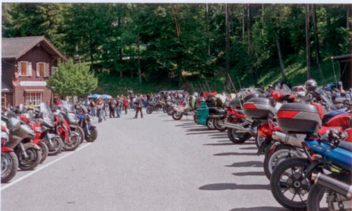
Les sorties de la FMVs, ici celle du printemps dernier, attirent beaucoup de fans.

_Ah! Je me suis trompé. Bien sûr que j'aime les Harley. Je voulais dire que je n'aime pas les japonaises (réd.: les motos évidemment). Disons que j'aime tous les bicylindres non bridés!