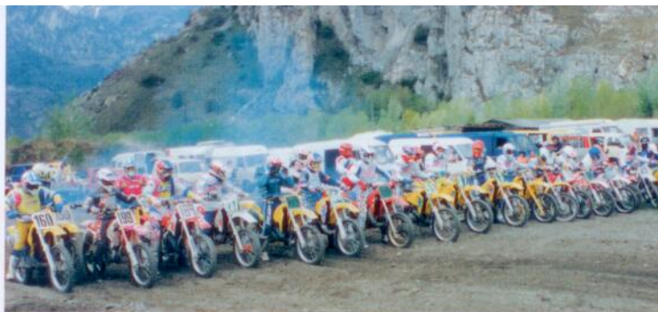
Jadis, on se bousculait au portillon sur la piste de cross de Verneys, sise sur une ancienne déponie mais pas moins disputée entre «écologues» et bétonneurs.

_Etes-vous plutôt moto électronique ou mécanique?