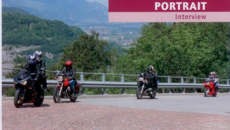
Au Valais, c'est facile: à peine passe-t-on la 2 e que ça grimpe dans les montagnes!

«Par contre, pour des motos électriques aucun problème!», minimise le vice-président de la FMVs. Alors, pas morte la piste des Verneys? «Non, pas forcément. Cela dépend de l'engagement de nos membres. On peut très bien imaginer la constitution d'un nouveau groupe de soutien à une renaissance de la piste. Mais pour cela, nous avons besoin de nouvelles forces, donc de vous ... les motards, exhorte-t-il, puis tempère: on ne peut pas demander aux motards d'acheter des prototypes chers!» rk